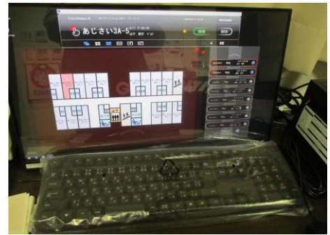
ナースコールシステム