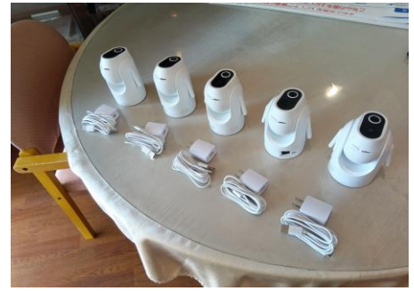
カメラ連携システム