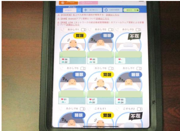
検知情報・睡眠情報・バイタル(呼吸、脈拍)情報の連携が図れます。 行動パターンと介護記録の相関を一覧やグラフを活用し、確認・分析できます。