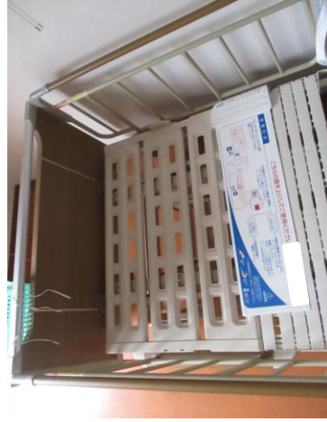
見守りシステムをマットレスの下に設置、在床管理機能が図れます