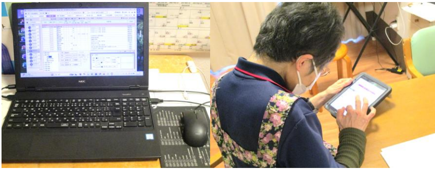
スマホ等でのリアルタイム記録。通知内容を自動反映させる運用連携。